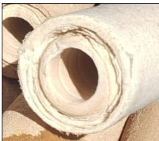
Figura 4 – Elemento filtrante deteriorado

12.7. Diante dos motivos explanados anteriormente e da importância do bom funcionamento desse equipamento, solicita-se a abertura de processo para compra contínua de elementos filtrantes para o CIP, a fim de garantir a eficiente operação da ETA Cristo Rei.