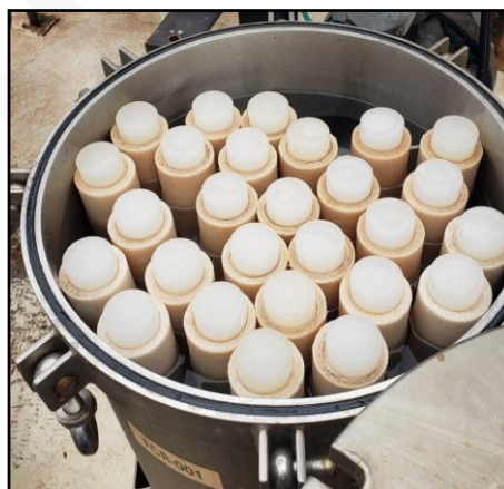
Figura 3 – Elementos filtrantes instalados dentro do filtro cartucho.

12.5. Após essa limpeza a pressão entre membranas diminui deixando-as aptas novamente para produção de água ultrafiltrada. Esse processo de limpeza é o indicado pelo fabricante das membranas. Atualmente na ETA Cristo Rei há um filtro cartucho que comporta 27 elementos filtrantes na linha de CIP (Figura 3).